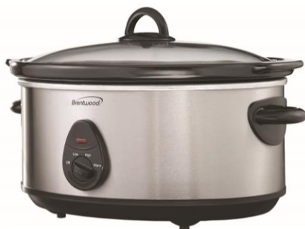
SC-150R ACIER INOXYDABLE

Consignes de sécurité et de fonctionnement