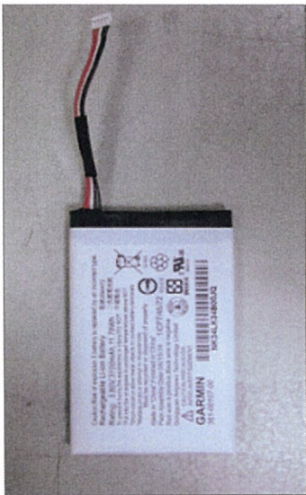
图 2: 正面 Figure 2: positive