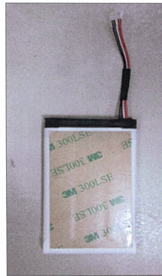
图 3: 反面 Figure 3: negative