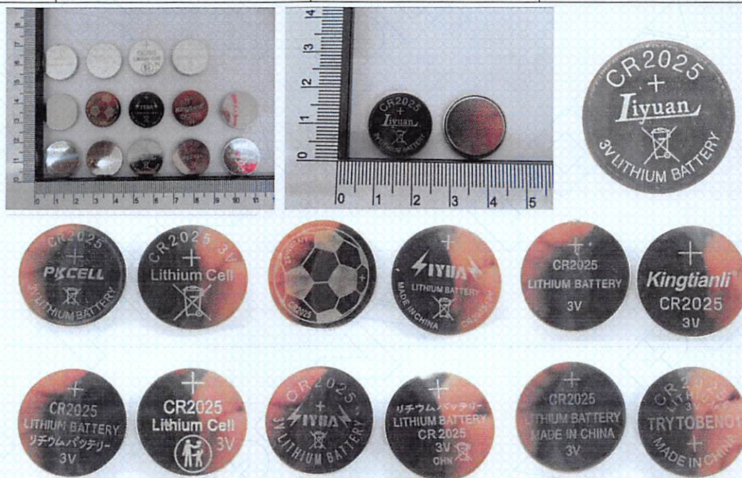
测试结论 Test Conclusion

测试样品符合《试验和标准手册》第七修订版第III部分 38.3 章节要求。 The tested samples meet the requirements of test items of the Manual of Tests and Criteria ST/SG/AC.10/11/Rev.7 Part III sub-section 38.3).