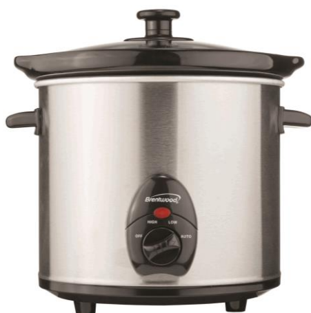
SC-130S ACIER INOXYDABLE