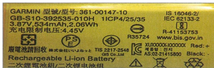
图 3: 标识 Figure 3: Logo